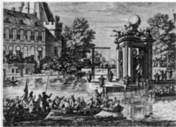
Tsar Peter (den store) besøker Amsterdam 1697.

I dag er en gruppe genealoger i Nederland opptatt med å katalogisere disse innskrivningene og legger da særlig vekt på å skille nordmenn fra andre skandinaver eller nord-tyskere (dvs holstenerne).